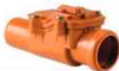
ҮЛ БУЦАХ КЛАПАН